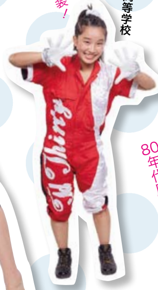
東京都立小山台高等学校