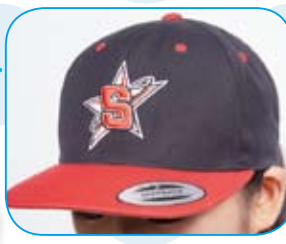
なんと全身オリジナル衣装!! 桜丘の「S」ロゴがカッコいい☆