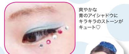
爽やかな青のアイシャドウにキラキラのストーンがキュート♡

a-nation内で行なわれた全国高等学校ダンス部選手権「DANCE CLUB CHAMPIONSHIP (通称：DCC)」！参加した全36校の、多彩な衣装スナップをご紹介します