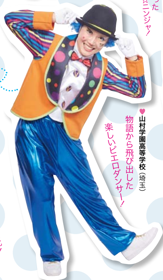
山村学園高等学校(埼玉)