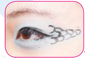
片方のアイメイクのみ 龍をイメージした ウロコが！