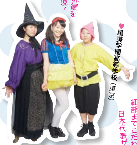
星美学園高等学校(東京)