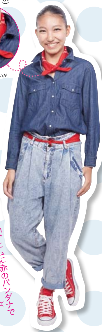
東京都立荒川商業高等学校