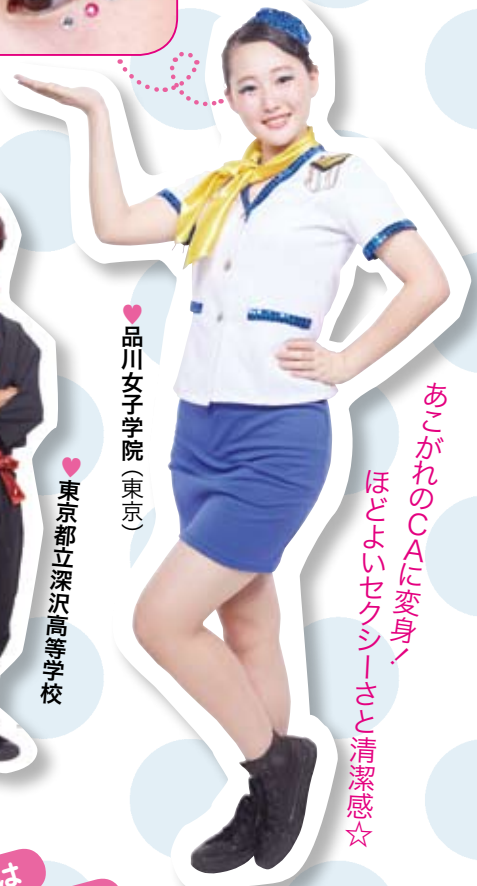
品川女子学院(東京)