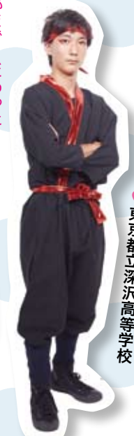
東京都立深沢高等学校