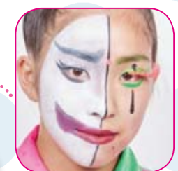
とにかくメイクがすごい！ 見る角度によって、 違う表情に☆