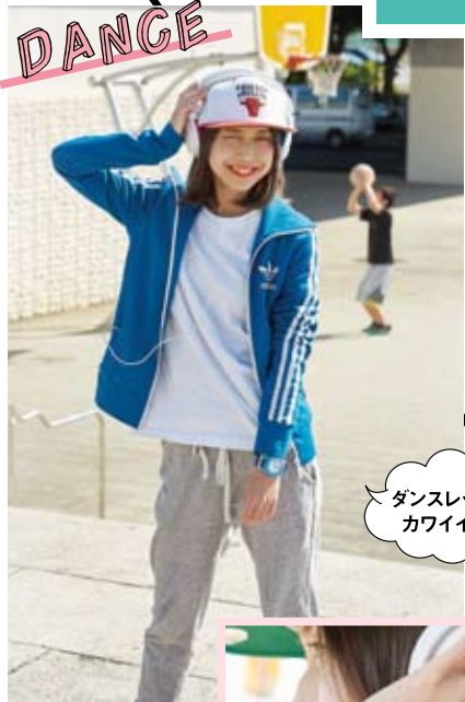
with BGA-180-2B3JF ¥15,500+税 ウェアの同系色でまとめましたよ!