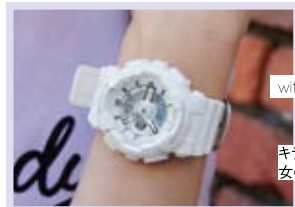
with BA-110-7A3JF ¥15,000+税 キラリと光る文字板が 女の子らしさプラス!