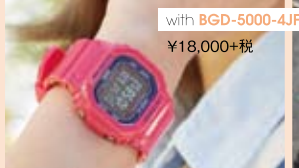
with BGD-5000-4JF ¥18,000+税 ぱっちりアクセになるビビッドピンク!