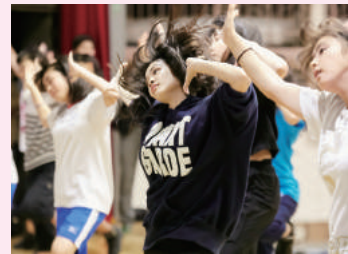
今月の表紙：神奈川県立光陵高等学校

●Staff Publisher 石原 久佳 Hisayoshi Ishihara Editor 川崎 麻由 Mayu Kawasaki Designer G-Co. Inc. / ARENSKI Photographer 渡邊 真朗 Noaki Watanabe 雨宮 透貴 Yukitaka Amemiya Printer 株式会社シーティーイー CTE, inc