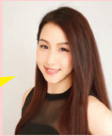
出身校 北陸学院短期大学

短大を卒業してからDA TOKYOに入学しました。在学中はダンスプロフェッショナルコースで、さまざまなジャンルのダンスの基礎を学び自分の特技を伸ばすことができました!