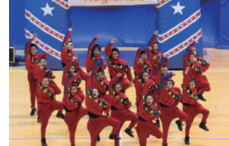
こちらは予選大会であるUSA Regionalsの模様

今回の巻頭企画でも紹介している「USA Nationals」の決勝戦が目前に控えている。他のダンス大会との大きな違いは、アメリカに本部のある組織による大会である点と、ステージや審査員の顔ぶれ、ダンスをスゴいテクニックとして捉えているため、照明効果のない正方形に近い広いステージでの演技を、国際基準をクリアした審査員によって細かくジャッジされる。また、優秀校は海外の大会へ推薦されるというから、規模の大きさもワールドワイドだ。いつもと違った大会の雰囲気や、多くのダンス仲間との活躍を体感しよう! ■3/25-26: School & College Nationals 2016@千葉・幕張メッセ