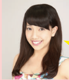
出身校 私立杉並学院高等学校

小学校のときからプロダンサーになりたいと思っていました。内定先のプランチャイムでは、様々なアーティストのバックダンサーが主な仕事になるので、精一杯がんばりたいです!