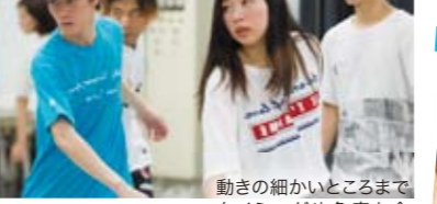
動きの細かいところまでタイミングや角度を合わせていきます。身体が覚えるまで踊り込み!