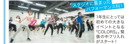
スタジオに集まったパフォーマンス科! 1年生にとっては初めての大きなイベントとなる「COLORS」。緊張の中フリ入れがスタート!

7月9日に新木場STUDIO COASTで行なわれたエンタテインメントイベント「COLORS」。ヴォーカル・タレントパフォーマンスコースの2年生に加え、パフォーマーコース1年生も出演しました! 本番直前のリハーサルをレポート☆