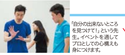
「自分の出来ないところを見つけよう」という先生。イベントを通してプロとしての心構えも身につけます。